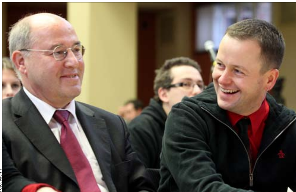
Gute Laune beim Landesparteitag der Berliner LINKEN am 27. und 28. November: Gregor Gysi und Klaus Lederer

W enn es ein Copyright auf Wahlkampflogans gäbe, könnten wir die politische Konkurrenz jetzt zur Kasse bitten. »Eine Stadt für Alle« fordern die Grünen, was sich stark an unserem Slogan »Berlin für alle« von 1999 anlehnt. »Berlin miteinander« will die SPD, das erinnert an unser »Miteinander für Berlin« aus dem Jahr 2001. Auch inhaltlich deckt sich vieles, was die Alphantiere Woweriet und Künast derzeit im Munde führen, mit unseren Forderungen: eine soziale Stadt, gute Bildung, leistungsfähige öffentliche Dienstleistungen, gute Arbeit.